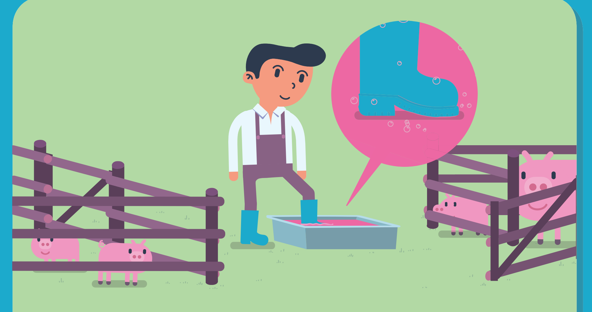
축사별 입구에서 신발 소독