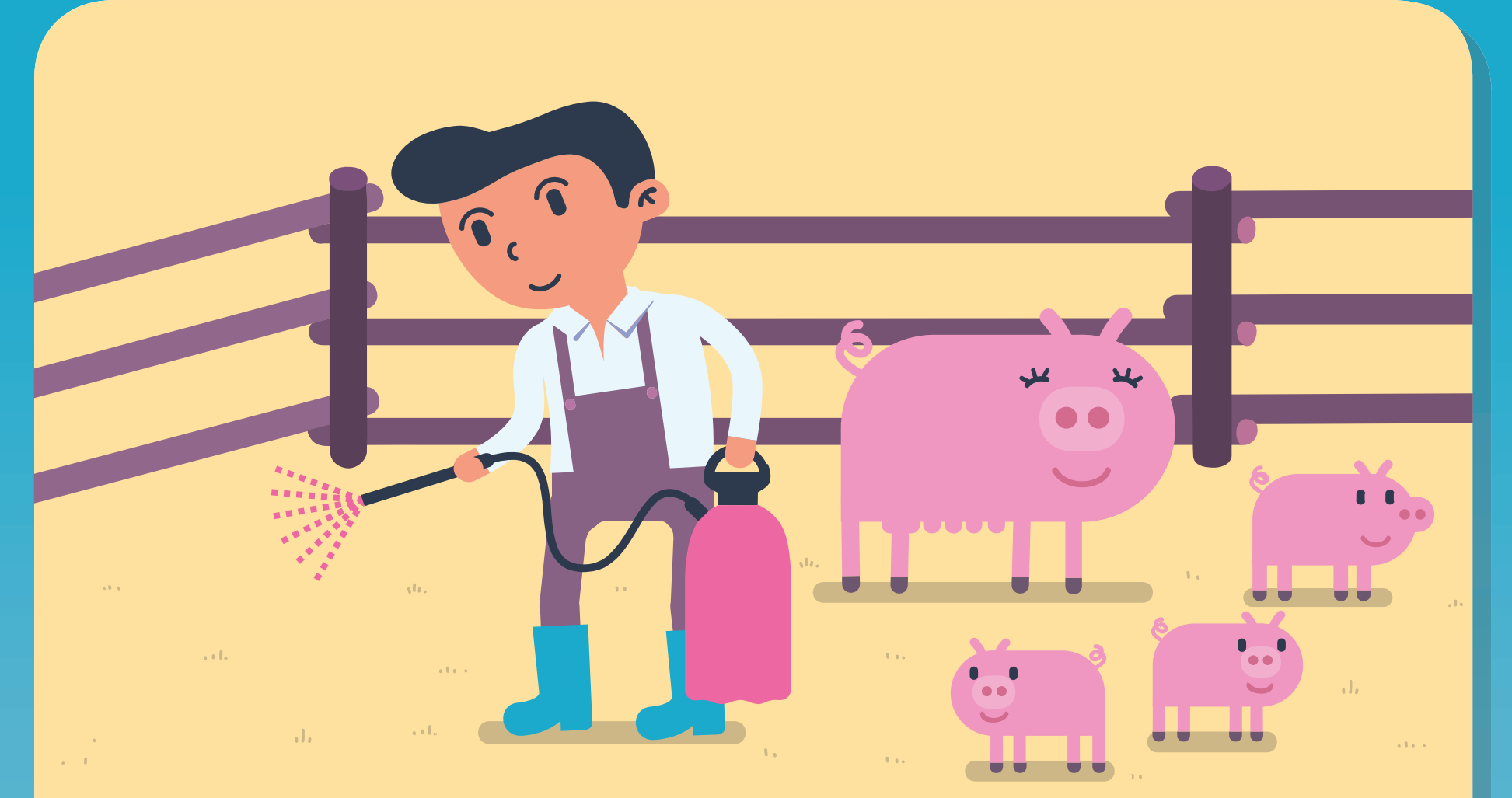
소독제나 생석회를 사용하여 정기적으로 농장 내 소독 실시