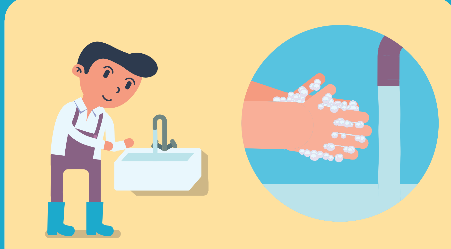
비누로 손 씻기