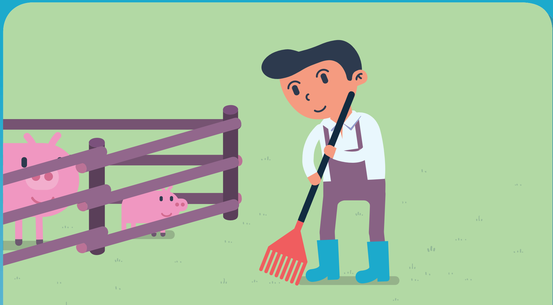
농장과 축사를 정기적으로 청소, 청결 유지