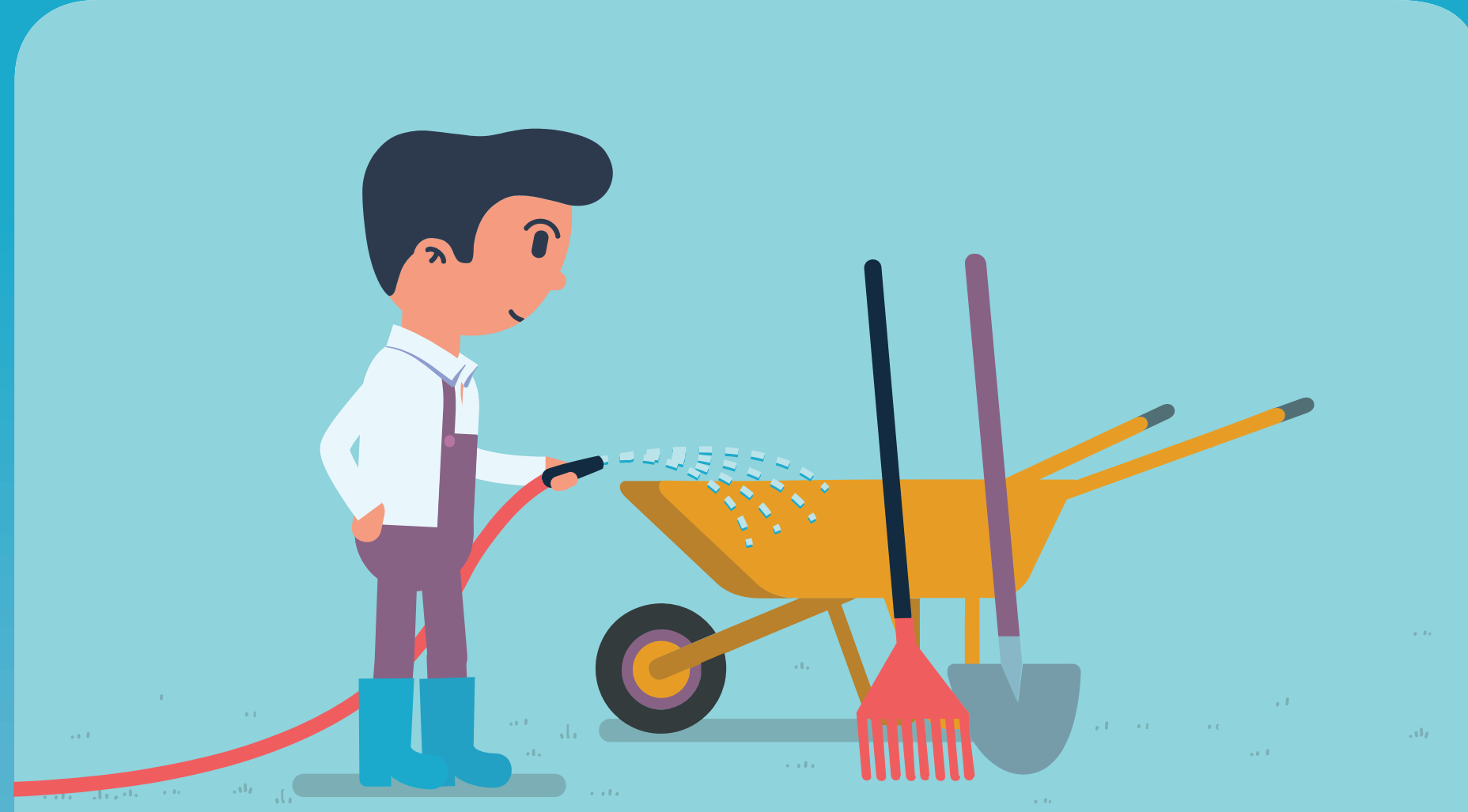
기구들은 농장내에서만 사용하고 사용전후 세척하여 보관