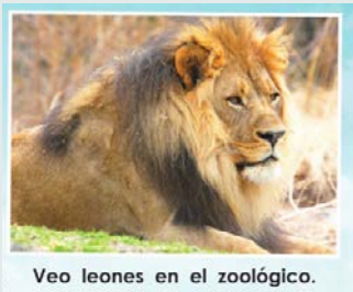
Veo leones en el zoológico.

Si su niño/niña lee , “Veo gatos en el zoológico,” invítelo a mirar la primera letra/el primer sonido en la segunda palabra, “leones.”